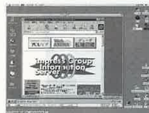
簡単にクロスプラットフォームの環境ができる