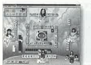
16人のアイドルタレントと対局できる