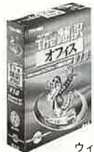
ウィンドウズ95/NTに対応している

問い合わせ●株式会社東芝 TEL 03-3457-2725 URL http://eiplaza.toshiba.co.jp/