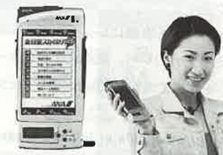
このPDAで東京・大阪への旅行が一層楽しくなる