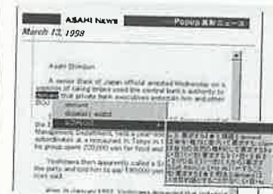
対象はasahi.comのEnglish Newsページ内「Asahi Evening News」

URL http://www.asahi.com/information/popup.html