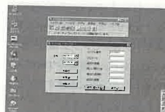
詳しい料金体系はホームページを参照